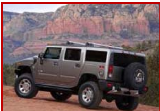
Autovettura Hummer H2 con Autista o similare

Le immagini presenti in questa pubblicazione sono da intendersi puramente indicative e non costituiscono obbligo alcuno