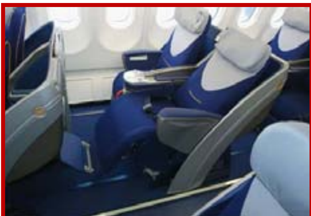
Volo aereo intercontinentale in Business Class