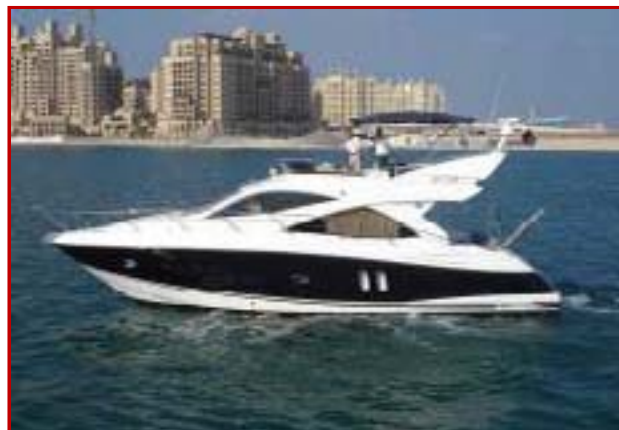
Sunseeker Manhattan 50 o similare